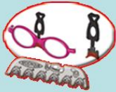
6つの形のノーズパッド