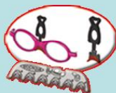
Plaquette de 6 formes de nez

Une gamme plastique avec un nez en silicone interchangeable, des branches réglables en longueur, un élastique de maintien et un clip solaire.